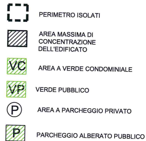
TAVOLA MODIFICATA A SEGUITO ACCOGLIMENTO OSSERVAZIONI