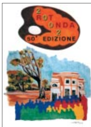
Annullo postale e cartolina Premio Rotonda 2002