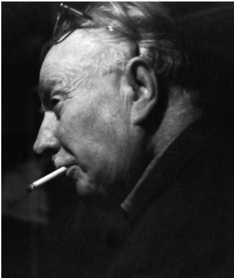
“Il sor Bruno”. Il fotografo Bruno Miniati

ho aggiunto la pinetina della rotonda, ho cercato di ricreare l'ambiente e la forza di quella situazione.