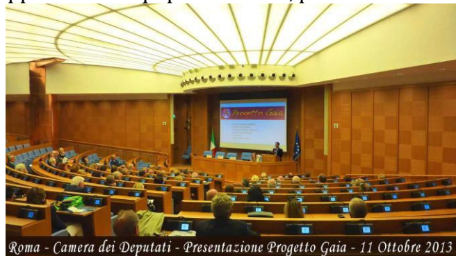
Roma - Camera dei Deputati - Presentazione Progetto Gaia - 11 Ottobre 2013

Il “Progetto Gaia-Benessere Globale” è un programma di educazione alla consapevolezza globale e alla salute psicofisica ideato e sviluppato da un'equipe di docenti, professori universitari, educatori, psicologi e medici dell'associazione di promozione sociale “Villaggio Globale” di Bagni di Lucca, che è stato approvato e finanziato dal Ministero del Lavoro e delle Politiche Sociali , e che è sostenuto dall’ UNESCO , l’agenzia delle Nazioni Unite per l’Educazione, la Scienza e la Cultura.